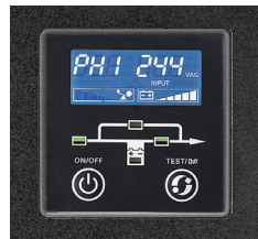
Display LCD con información clara del estatus y mediciones del UPS